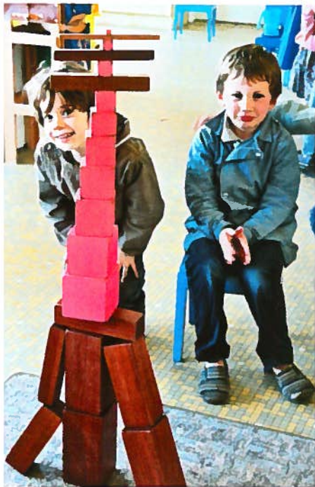
Quand la "tour rose" rencontre "l'escalier brun", les volumes prennent sens.

Maria Montessori nous a souvent répété que l'enfant a des besoins que notre "raison" ignore. Il suit une voie/voix intérieure, spontanée et répétitive qui le pousse, par exemple, vers des activités sensorielles et motrices invincibles. Ce comportement extérieur reflète son activité sensible et psychique intérieure.